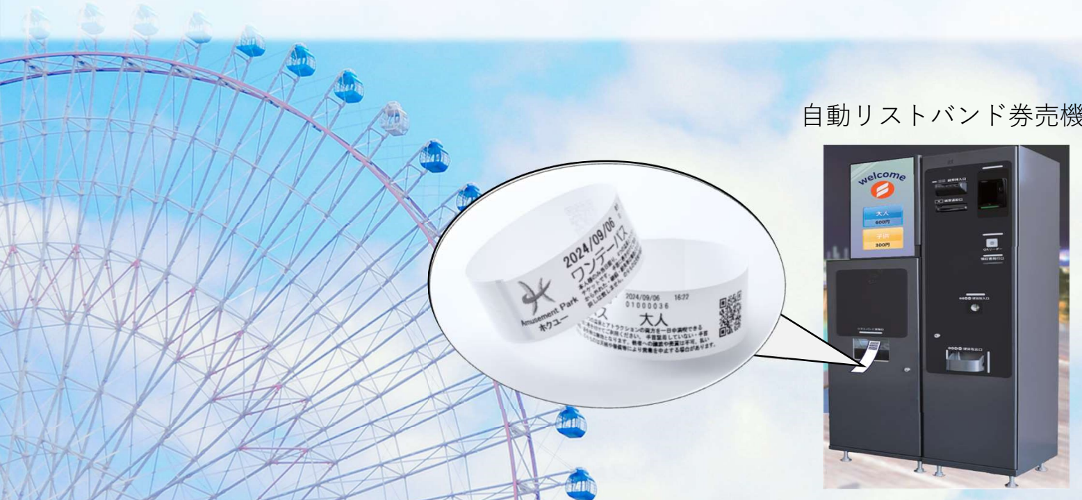
自動リストバンド券売機